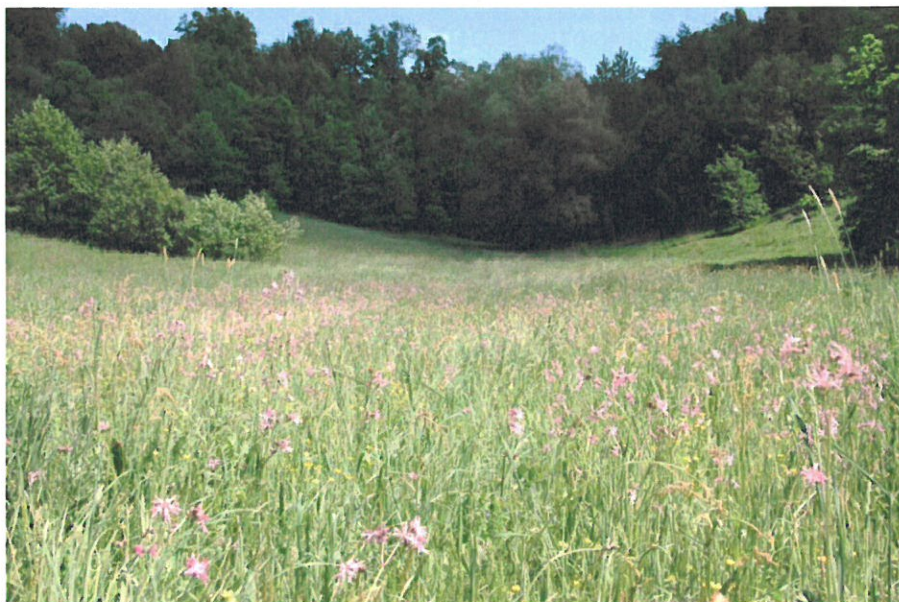
Urokliwe łąki na terenie sołectwa