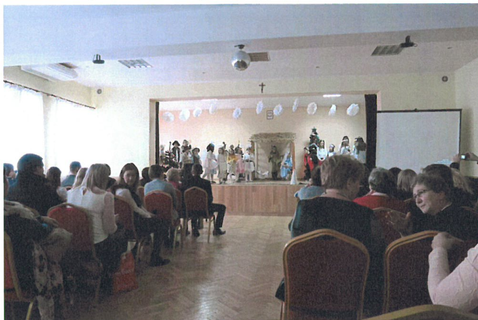
Wspólne kolędowanie w Domu Ludowym w Brzezówce