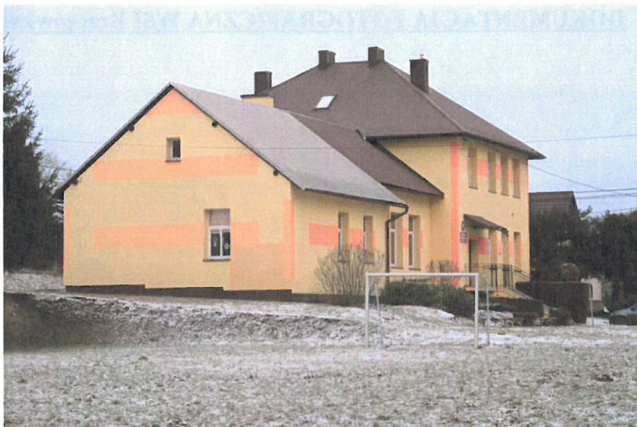
Budynek Szkoły Podstawowej w Brzeźowce