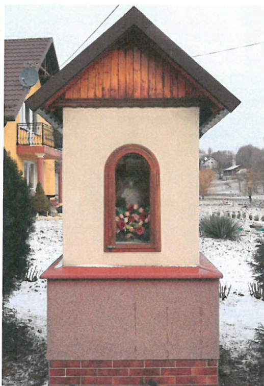
Jedna z kapliczek na terenie wsi Brzezówka