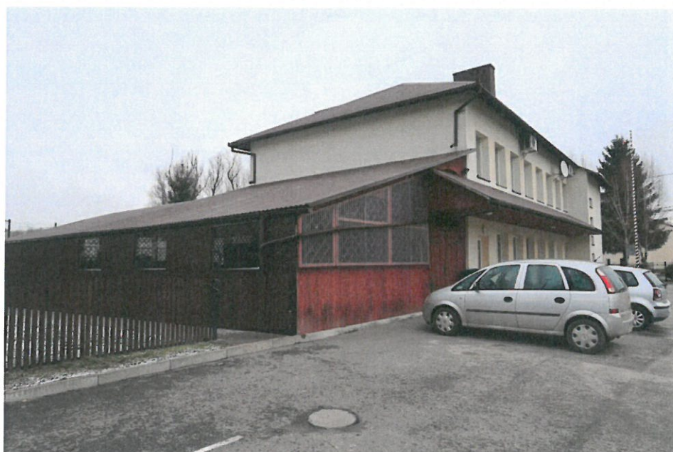
Budynek domu Ludowego w Brzezówce wraz z wiatą taneczną