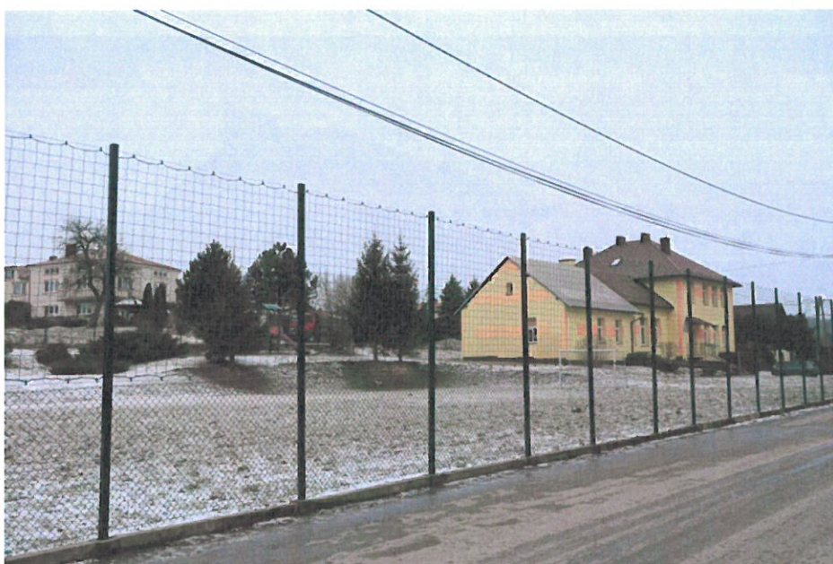
Budynek Szkoły Podstawowej w Brzeźowce wraz z boiskiem