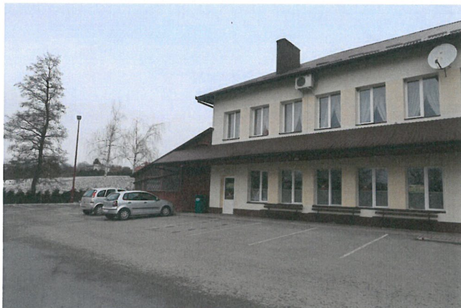
Budynek Domu Ludowego w Brzezówce