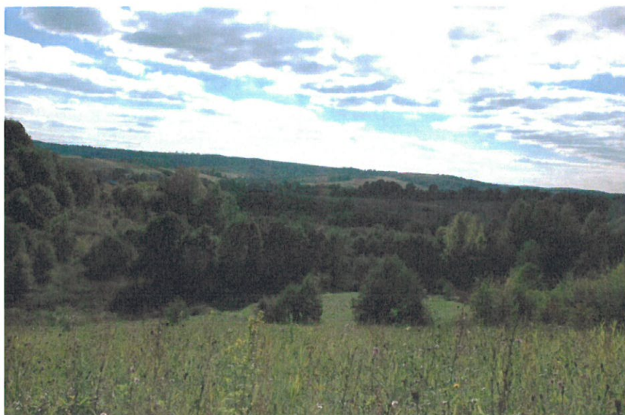
Widok na lasy, łąki i pagórki