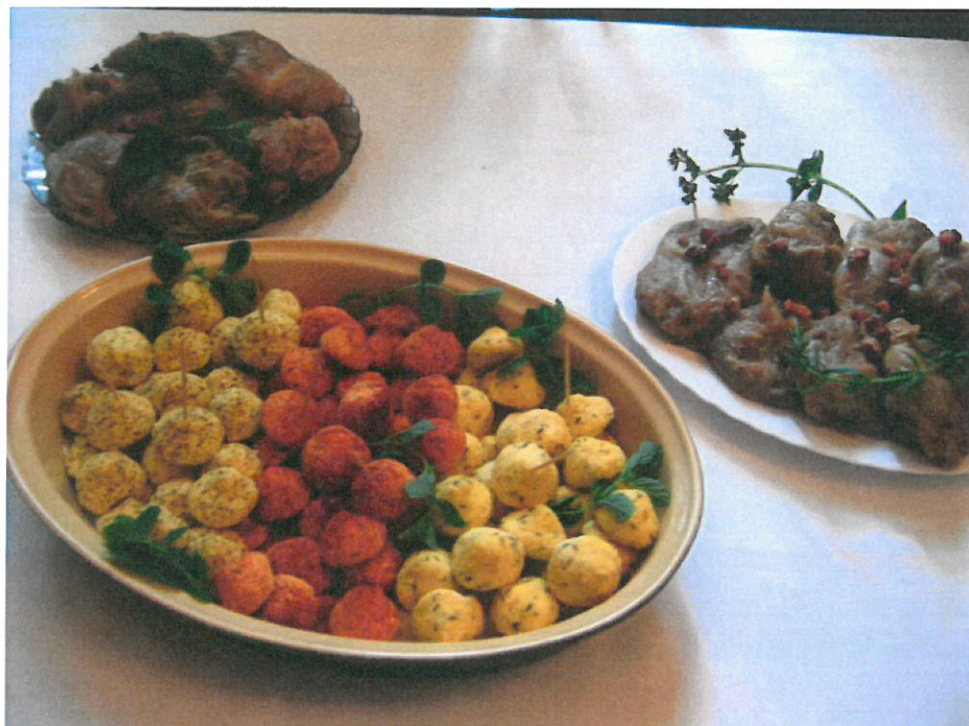
Potrawy tradycyjne: gomółki i goląbki z ziemniaków