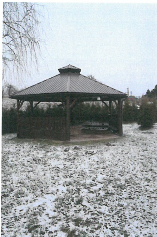
Altana z grillem