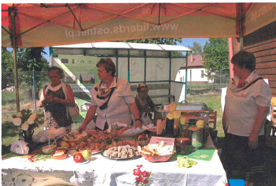
Prezentacja potraw tradycyjnych (Stowarzyszenie Rozwoju i Odnowy Wsi w Brzezówce)