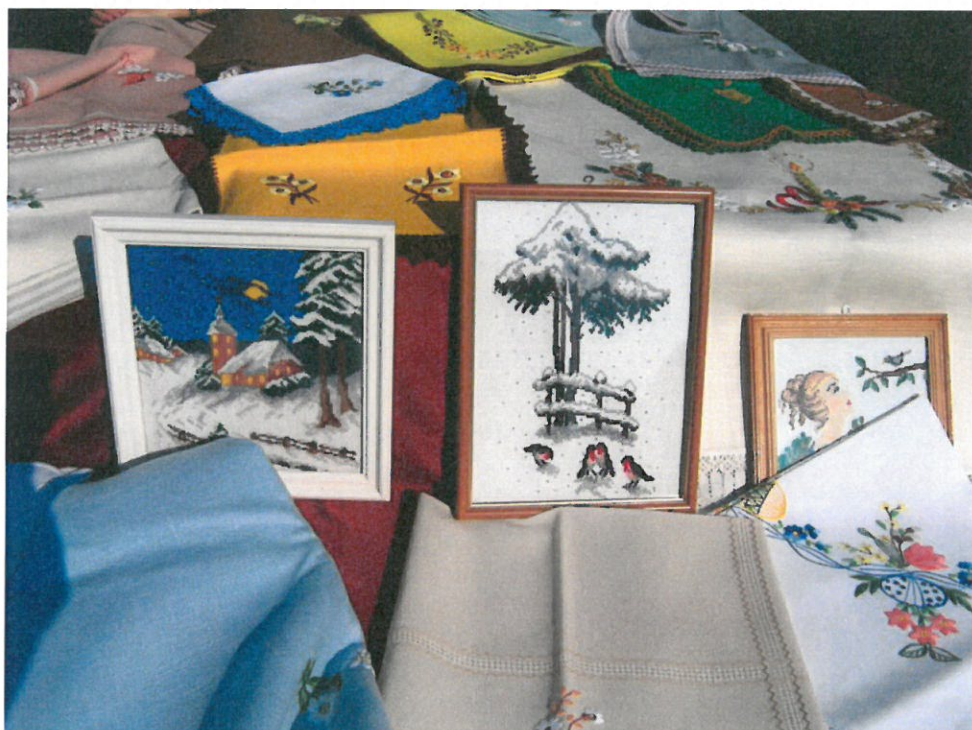
Obrusy i serwety haftowane przez mieszkankę Brzezówki