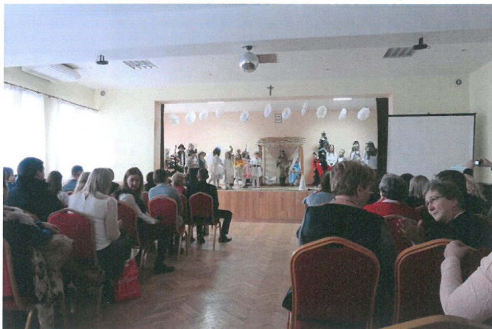
Wspólne kolędowanie w Domu Ludowym w Brzeźowce