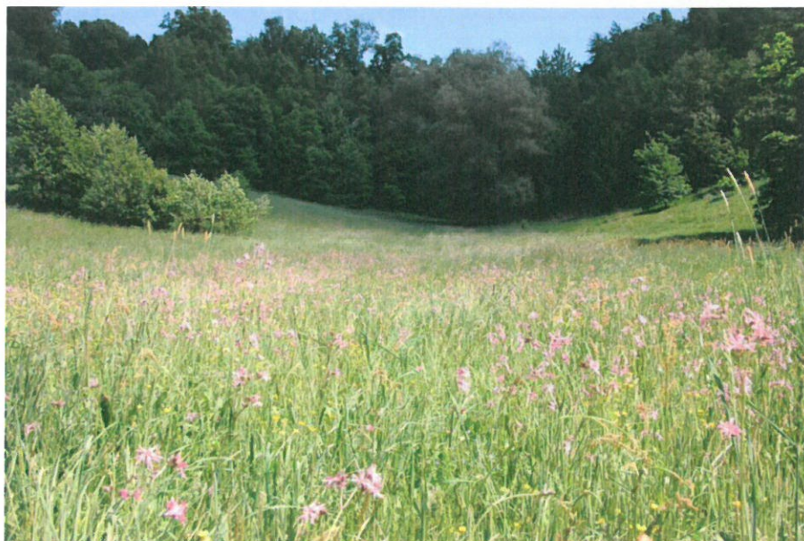
Urokliwe łąki na terenie sołectwa