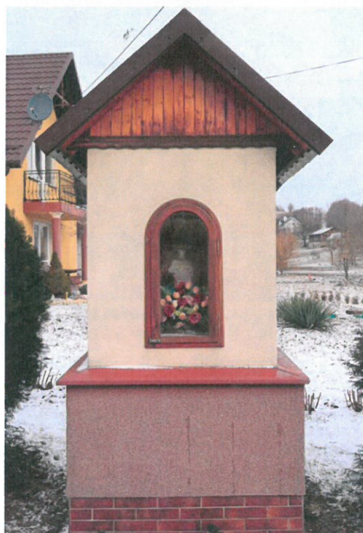
Jedna z kapliczek na terenie wsi Brzezówka