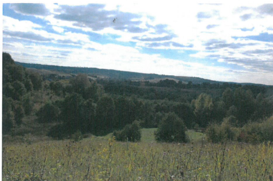
Widok na lasy, łąki i pagórk