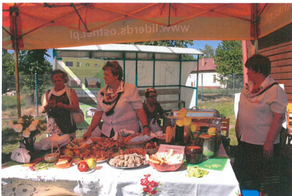
Prezentacja potraw tradycyjnych (Stowarzyszenie Rozwoju i Odnowy Wsi w Brzeźowce)