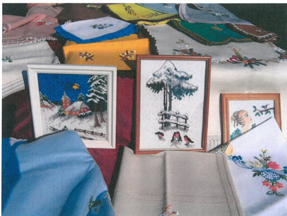
Obrusy i serwety haftowane przez mieszkankę Brzezówki