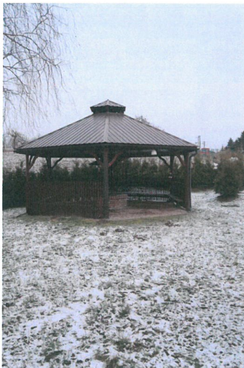
Altana z grillem