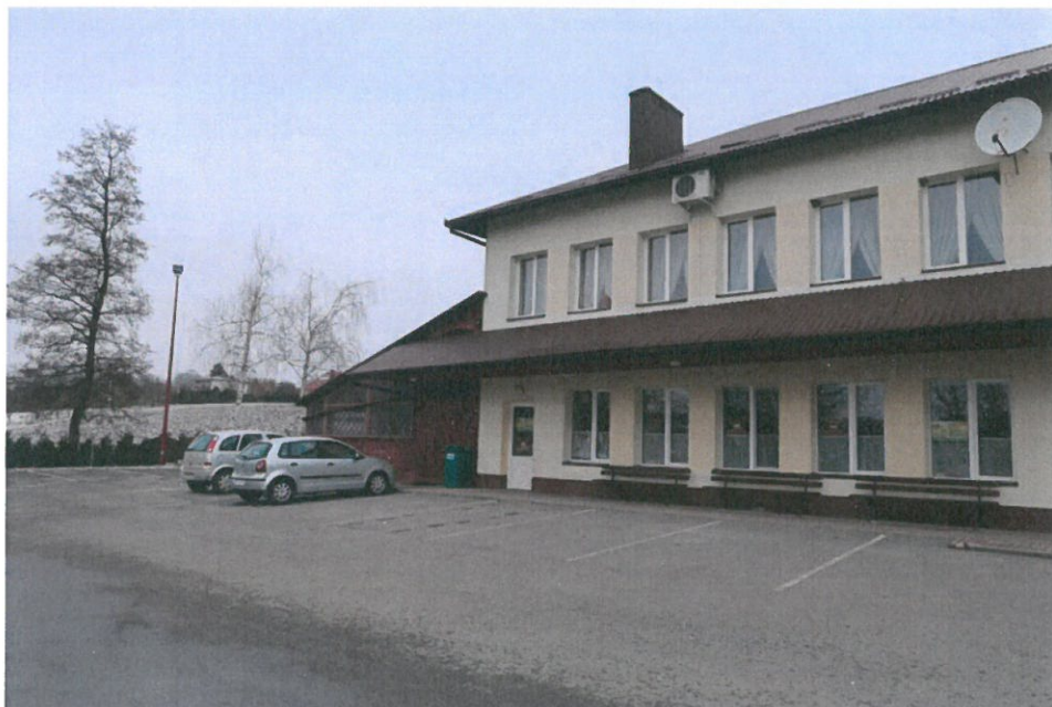
Budynek Domu Ludowego w Brzezówce