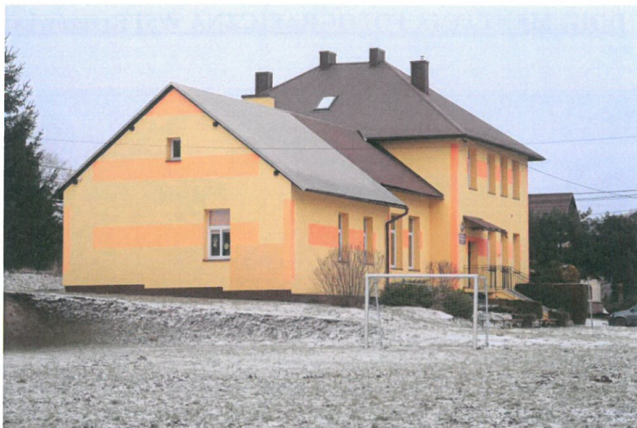
Budynek Szkoły Podstawowej w Brzezówce