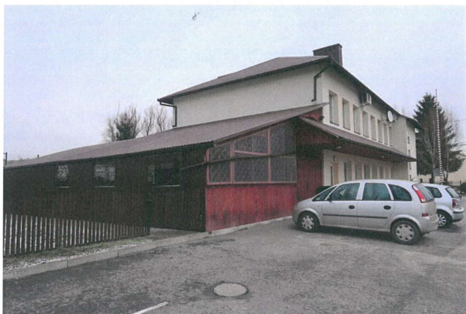
Budynek domu Ludowego w Brzezówce wraz z wiatką taneczną