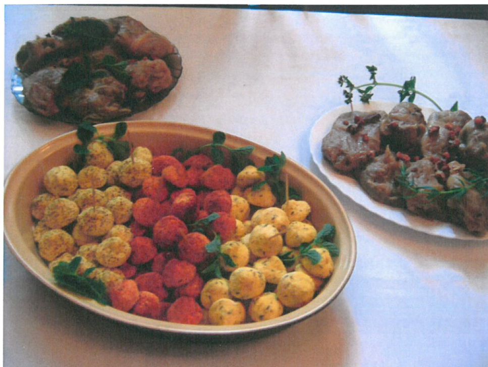
Potrawy tradycyjne: gomółki i golębki z ziemniaków