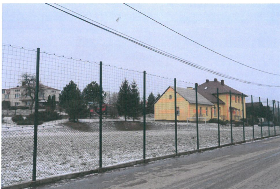
Budynek Szkoły Podstawowej w Brzezówce wraz z boiskiem