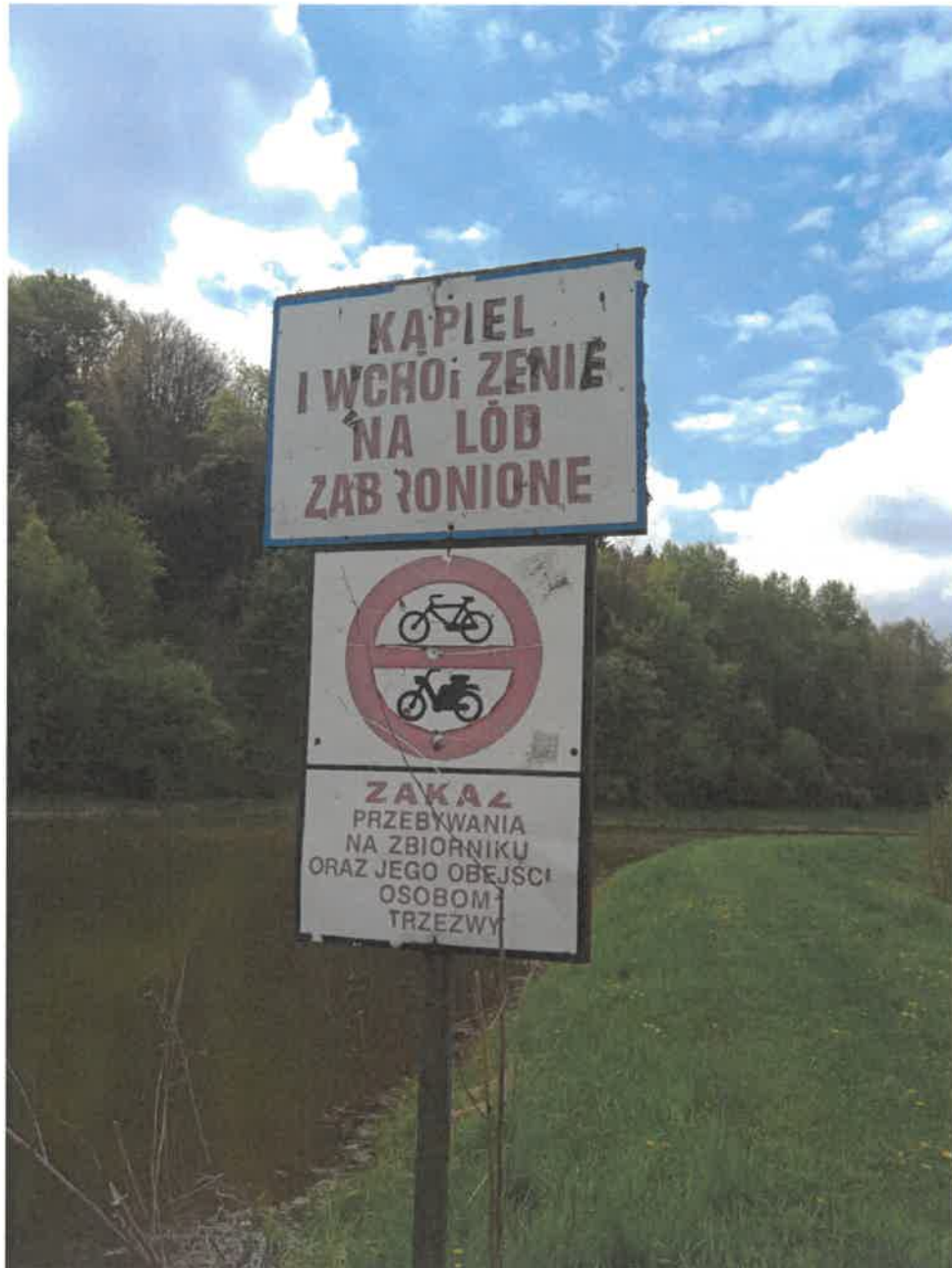
3. Zalew w Dylągówce – widok na tabliczkę informującą o zakazie kąpieli.