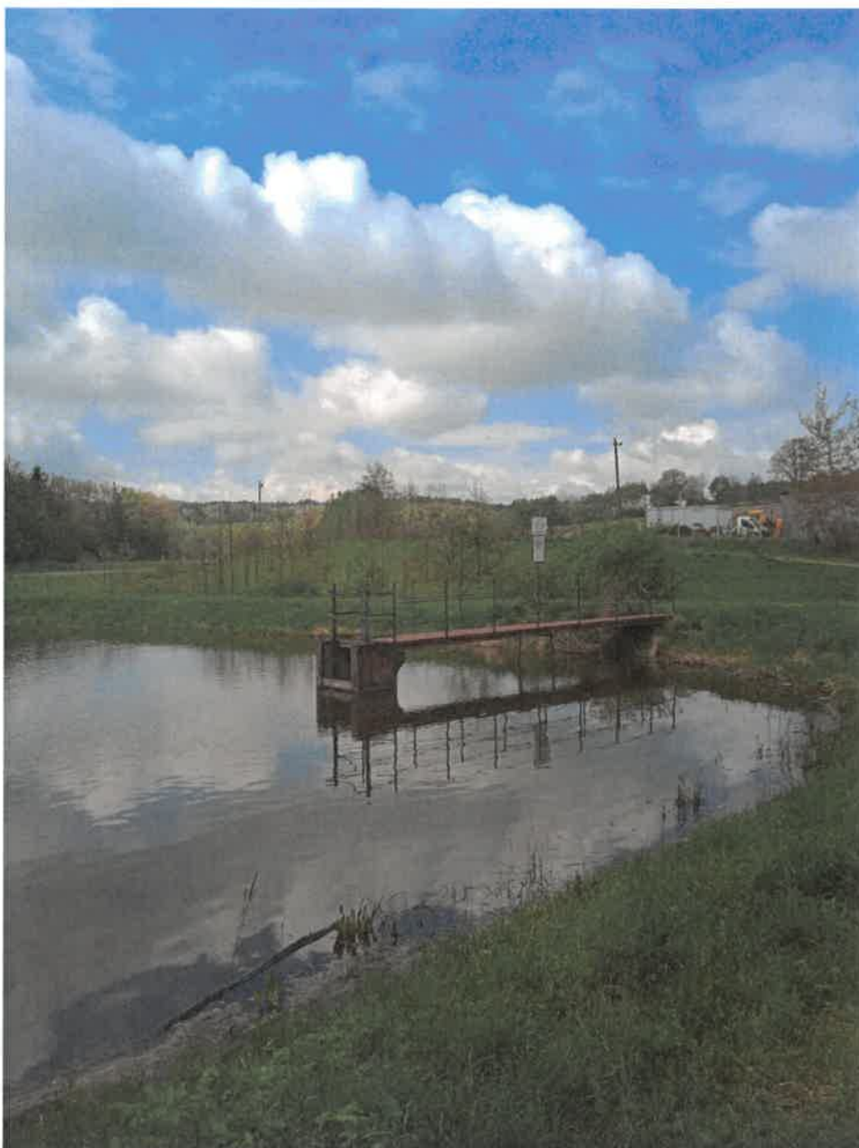
4. Zalew w Dylągówce – zasuwa spustowa na zbiorniku retencyjnym.