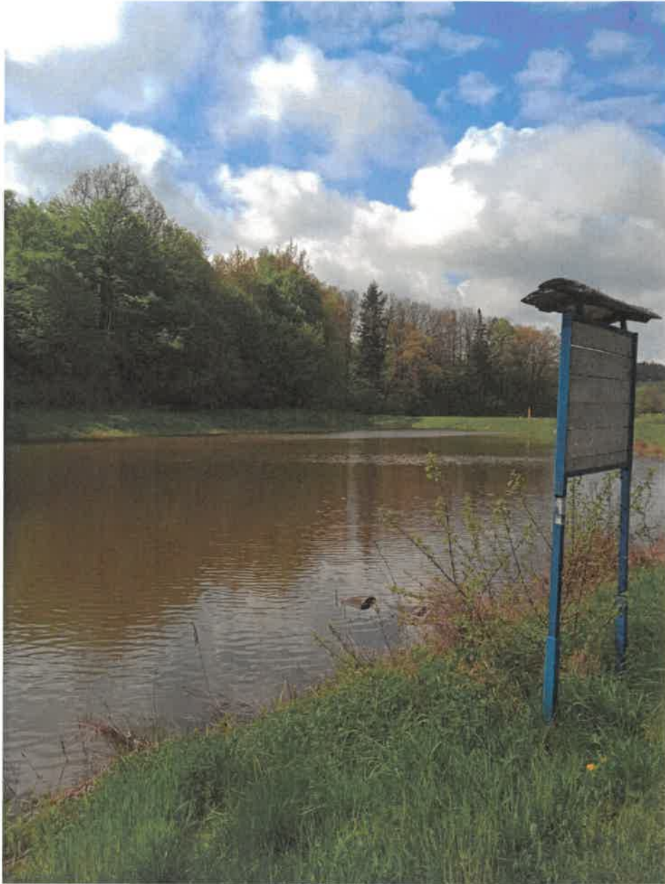
2. Zalew w Dylągówce.